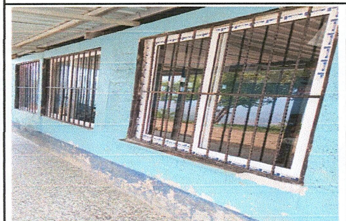
Foto 3: VENTANAS: SE DEBE MEJORAR EL AREA DE LAS VENTANAS DEL MODULO 2